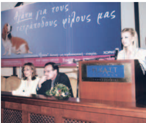
▲ Αγάπη για τα αδέσποτα ζώα