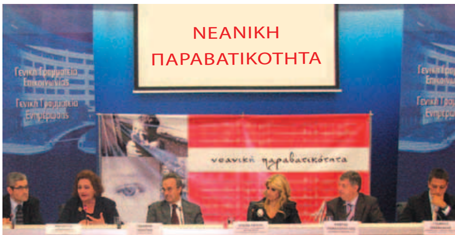
▲ Η Αγάπη αντιμετωπίζει τη νεανική παραβατικότητα