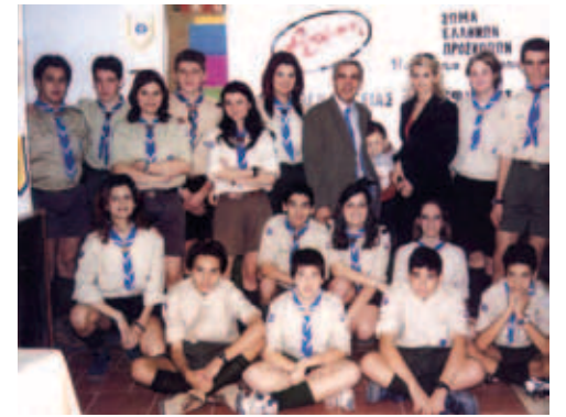
▲ Η Αγάπη κοντά στους προσκόπους