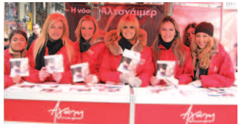
▲ Η Αγάπη ευαισθητοποιεί για τη νόσο αλτσχάιμερ