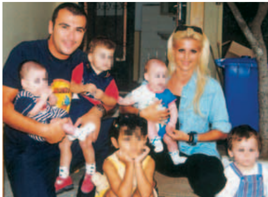
▲ Αγάπη για τον «Άγιο Στυλιανό»