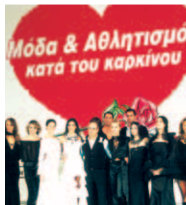
▲ Η Αγάπη στον αγώνα κατά του καρκίνου