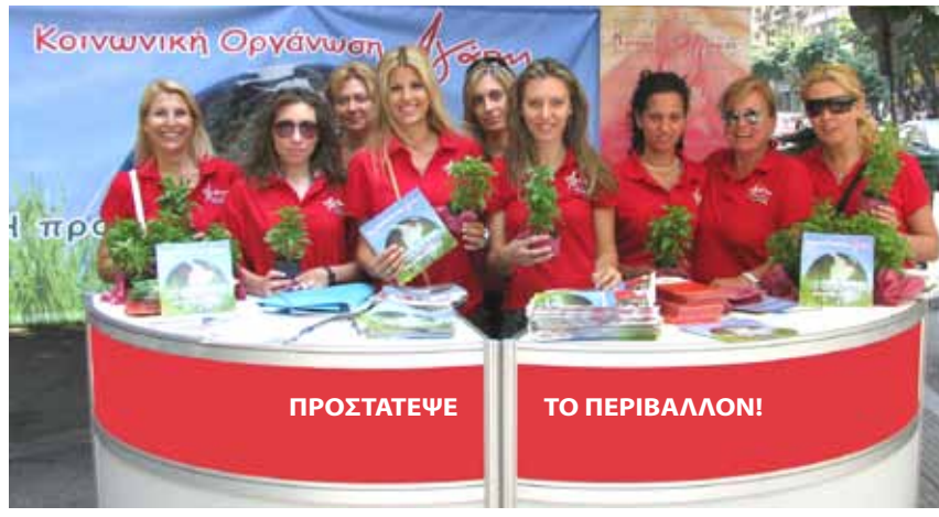
▲ Η Αγάπη προστατεύει το περιβάλλον