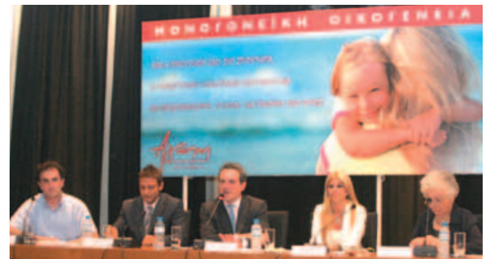
▲ Η Αγάπη αγκαλιάζει τις μονογονικές οικογένειες