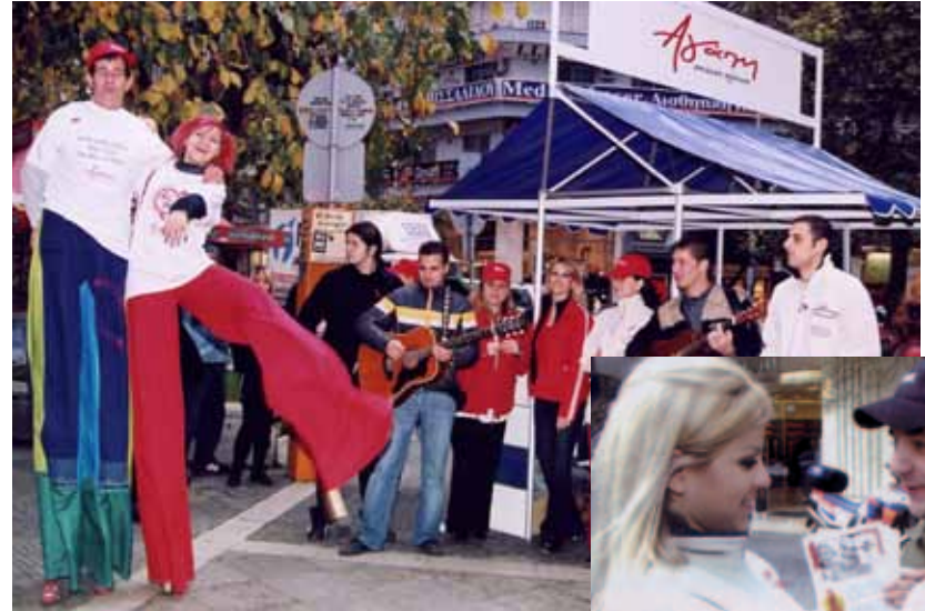
▲ Η Αγάπη στην πρώτη γραμμή του αγώνα κατά του aids