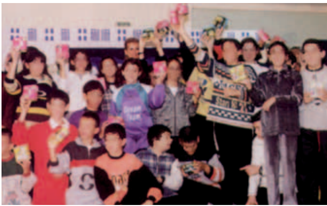
▲ Η Αγάπη υποστηρίζει την αποταμίευση