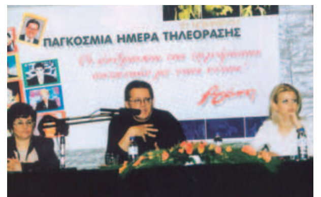
▲ Αγάπη και μέσα μαζικής ενημέρωσης