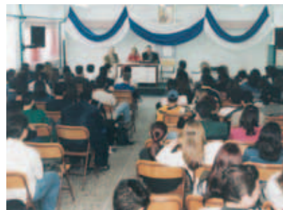
▲ Η Αγάπη μιλά για την πνευματική ιδιοκτησία