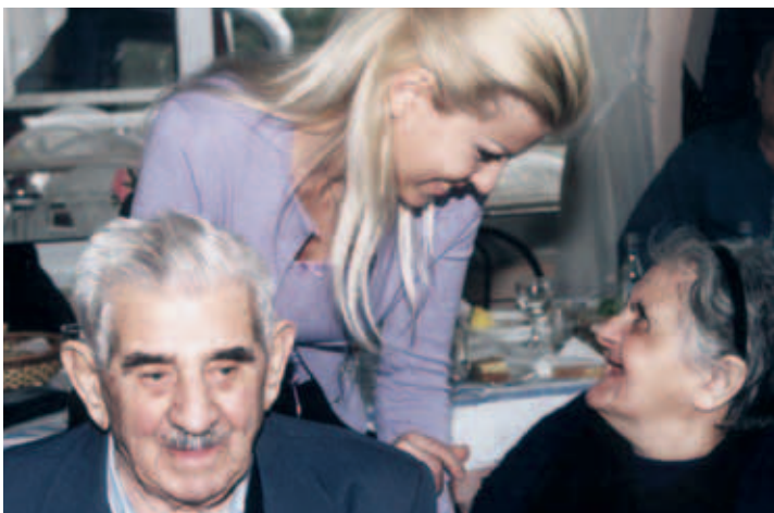
▲ Η Αγάπη κοντά στα πιο αγαπημένα πρόσωπα