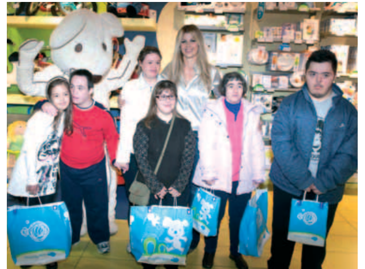
▲ Η Αγάπη κοντά στα παιδιά με σύνδρομο Down