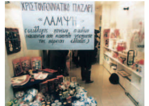
▲ Η Αγάπη κοντά στα παιδιά που δίνουν μάχη για τη ζωή