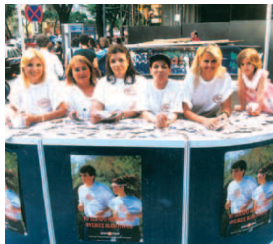
▲ Το κάννισμα βλάπτει σοβαρά την Αγάπη