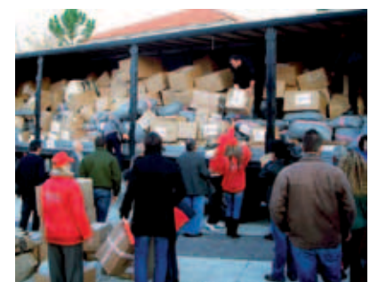
▲ Η Αγάπη ανακουφίζει τους πυροπαθείς με την αποστολή ειδών πρώτης ανάγκης (τρόφιμα, φάρμακα, ρουχισμός κ.ά.) με την υποστήριξη των ολυμπιονικών