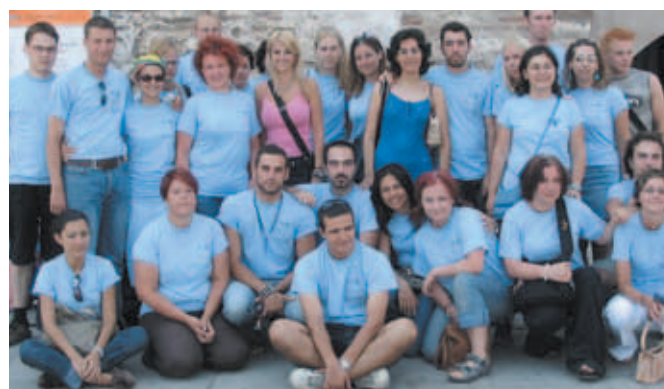
▲ Με Αγάπη για τη νεολαία