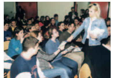
▲ Η Αγάπη ευαισθητοποιεί για την αξία του νερού