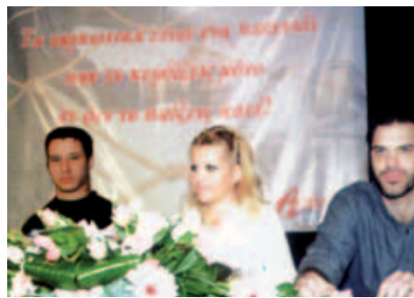
▲ Η Αγάπη κατά των ναρκωτικών