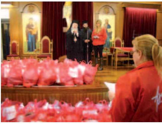
▲ Δέματα με τρόφιμα γεμάτα Αγάπη σε άπορες οικογένειες