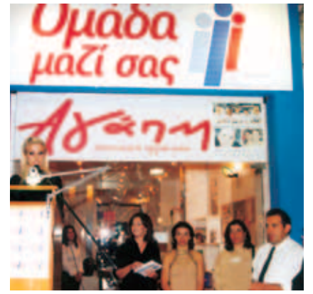
▲ Η Αγάπη εγκαινιάζει κέντρο ενημέρωσης για τον εθελοντισμό