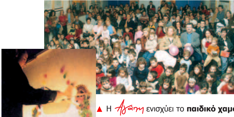
▲ Η Αγάπη ενισχύει το παιδικό χαμόγελο