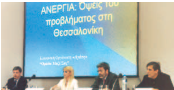
▲ Η Αγάπη δίνει αγώνα ενάντια στην ανεργία