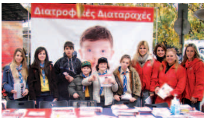
▲ Η Αγάπη ενημερώνει για τις διατροφικές διαταραχές