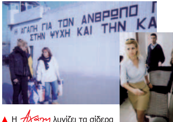
▲ Η Αγάπη λυγίζει τα σίδερα