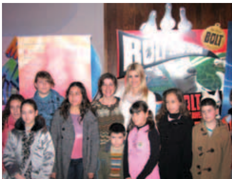
▲ Η Αγάπη σινεφίλ