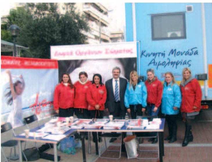
▲ Η Αγάπη δημιουργεί τράπεζα αίματος

«Ἐάν ταις γλώσσαις τῶν ἀνθρώπων λαλῶ καὶ τῶν ἀγγέλων, ἀγάπην δὲ μὴ ἔχω, γέγονα χαλκὸς ἤχων ἢ κύμβαλον ἀλαλάζον... Ἡ ἀγάπη μακροθυμεῖ, χρηστεύεται, ἡ ἀγάπη οὐ ζηλοῖ... Ἡ ἀγάπη οὐκ ἀσχημονεῖ, οὐ ζητεῖ τὰ ἑαυτῆς, οὐ παροξύνεται... πάντα πιστεύει, πάντα ἐλπίζει, πάντα ὑπομένει. Ἡ ἀγάπη οὐδέποτε ἐκπίπτει. Εἴτε δὲ προφητεῖαι, καταργηθήσονται· εἴτε γλώσσαις παύσονται· εἴτε γνῶσις καταργηθήσεται... Νυνὶ δὲ μένει πίστις, ἐλπίς, ἀγάπη, τὰ τρία ταῦτα· μείζων δὲ τούτων ἡ ἀγάπη». Πρὸς Κορινθίους Α' Ἀποστόλου Παύλου