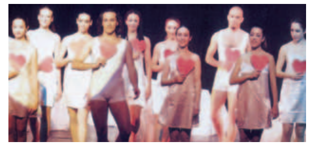
▲ Αγάπη και πολιτισμός ενάντια στη λευχαιμία Ομάδα χορού Ballet Tan