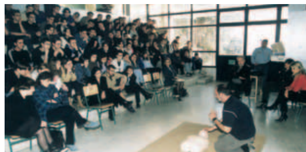
▲ Η Αγάπη δίνει το φιλί της ζωής