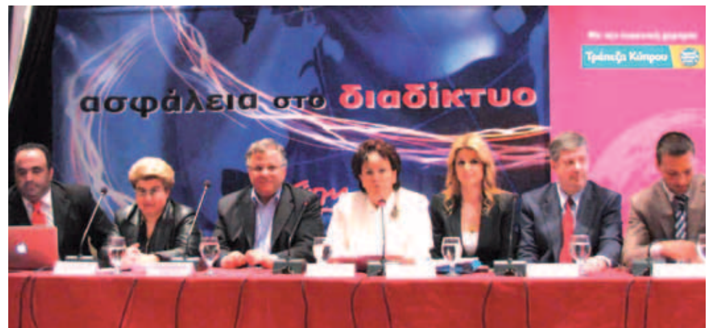
▲ Η Αγάπη στον αγώνα για ένα ασφαλές διαδίκτυο